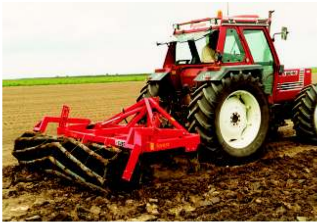
Teilbarer Grubber „Forest“ LE-9K R62, mit Walze 62 cm, mit 8 2-Zoll-Rohren V-förmig angeordnet.

Auch in Hardox-stahl (verschleiß- und biegefest)