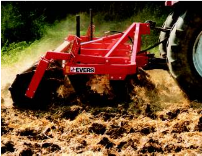
Grubber „Forest“ LE-9K R62, mit Walze 62 cm.