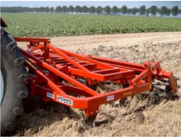
Schichtengrubber Forest LGE-13D